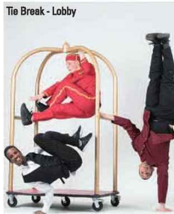
Tie Break - Lobby

Ils sont huit qui, après avoir sillonné le monde entier pendant plus de vingt ans avec le Pockemon Crew, ont décidé de construire un nouveau projet qui conçoit la danse comme un lieu de partage et de divertissement. Leur première création, Lobby , s'inspire du nouveau cirque, de la comédie musicale, alliant une expression théâtrale à la performance technique du break dance pour décrire une vie mouvementée, construite sur le rythme effréné des voyages et des tournées. Au public qui ne connaît pas l'envers du décor, ils ont décidé de raconter leur second foyer : les hôtels. Ils ont ainsi écrit des saynètes, souvent comiques, montrant les halls d'hôtel avec leurs rencontres insolites,