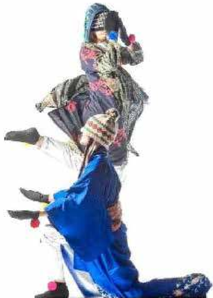
Les petites formes des voyages seront interprétées en duo. La plus grande version sera dansée par quatre interprètes.