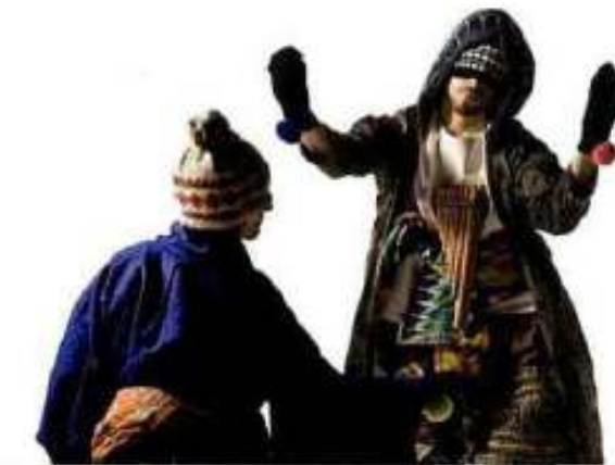
Dans ce monde Thomas Lebrun

Les danseurs vêtus d'abord d'une blanche neutralité se parent peu à peu d'accessoires, de costumes, pour figurer les pays