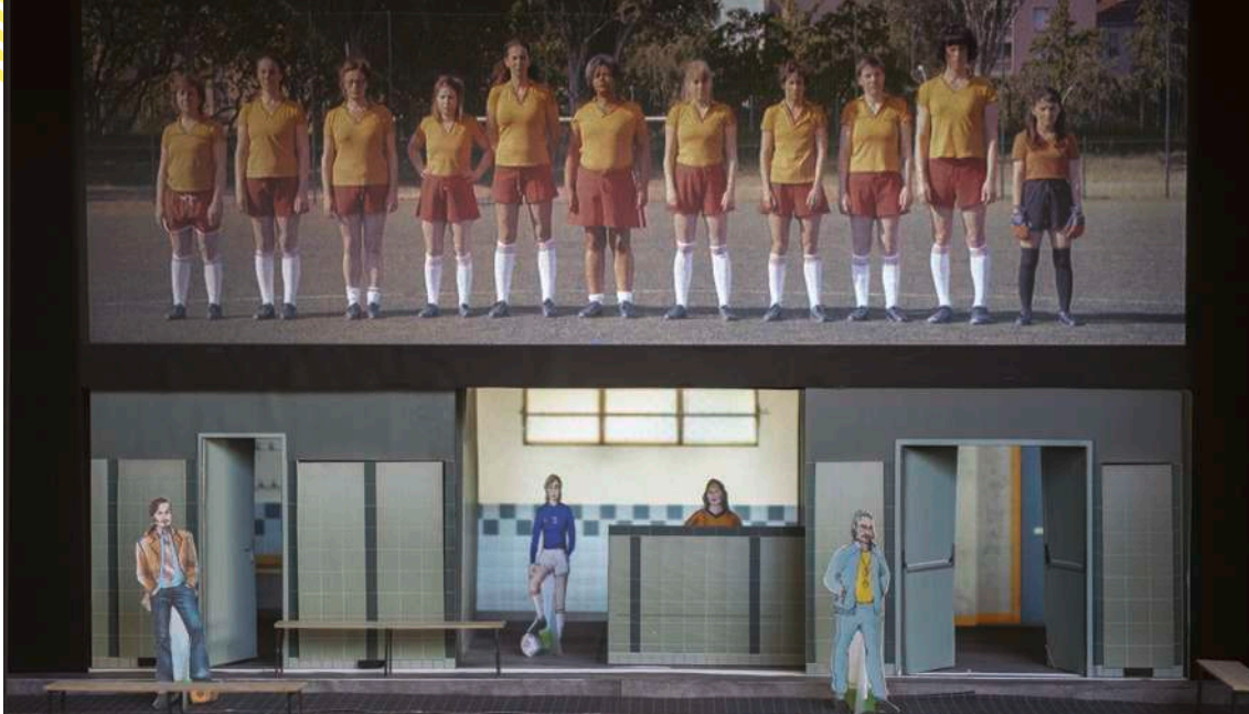
Photo de la maquette du décor, septembre 2019.