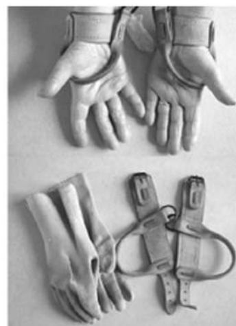
Extrait de Fanny Gallot, En découdre , La Découverte, 2015.