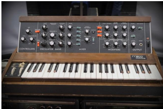
Le synthétiseur Minimoog