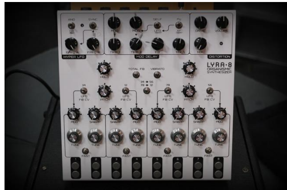
Le synthétiseur Lyra 8