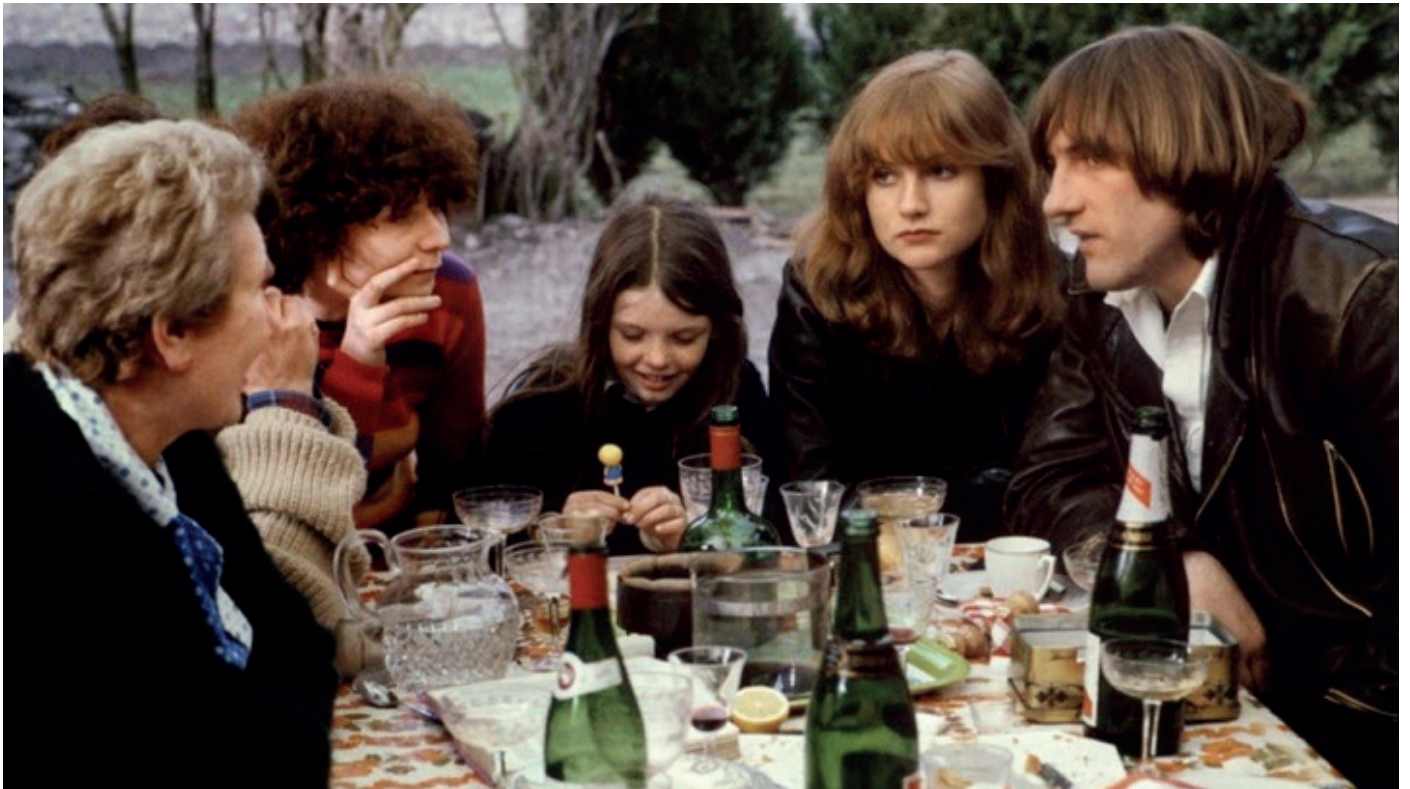
Loulou , 1980

Après toutes ces lectures, j'ai senti la nécessité de rencontrer des personnes intimement liées à Maurice Pialat, qui ont participé au film, ou y ont consacré une part de leur travail. Je voulais leur parler de mon désir d'adapter A nos amours au théâtre, leur soumettre les quelques intuitions que j'avais, et les questionner pour continuer à avancer.