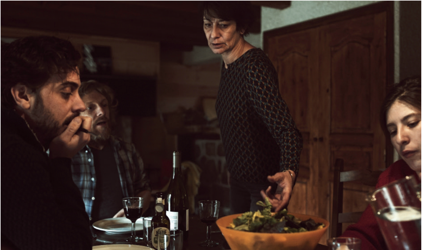
Répétition ANA

De très nombreux films sont des adaptations d'œuvres littéraires ou dramatiques. C'est beaucoup plus rare dans l'autre sens.