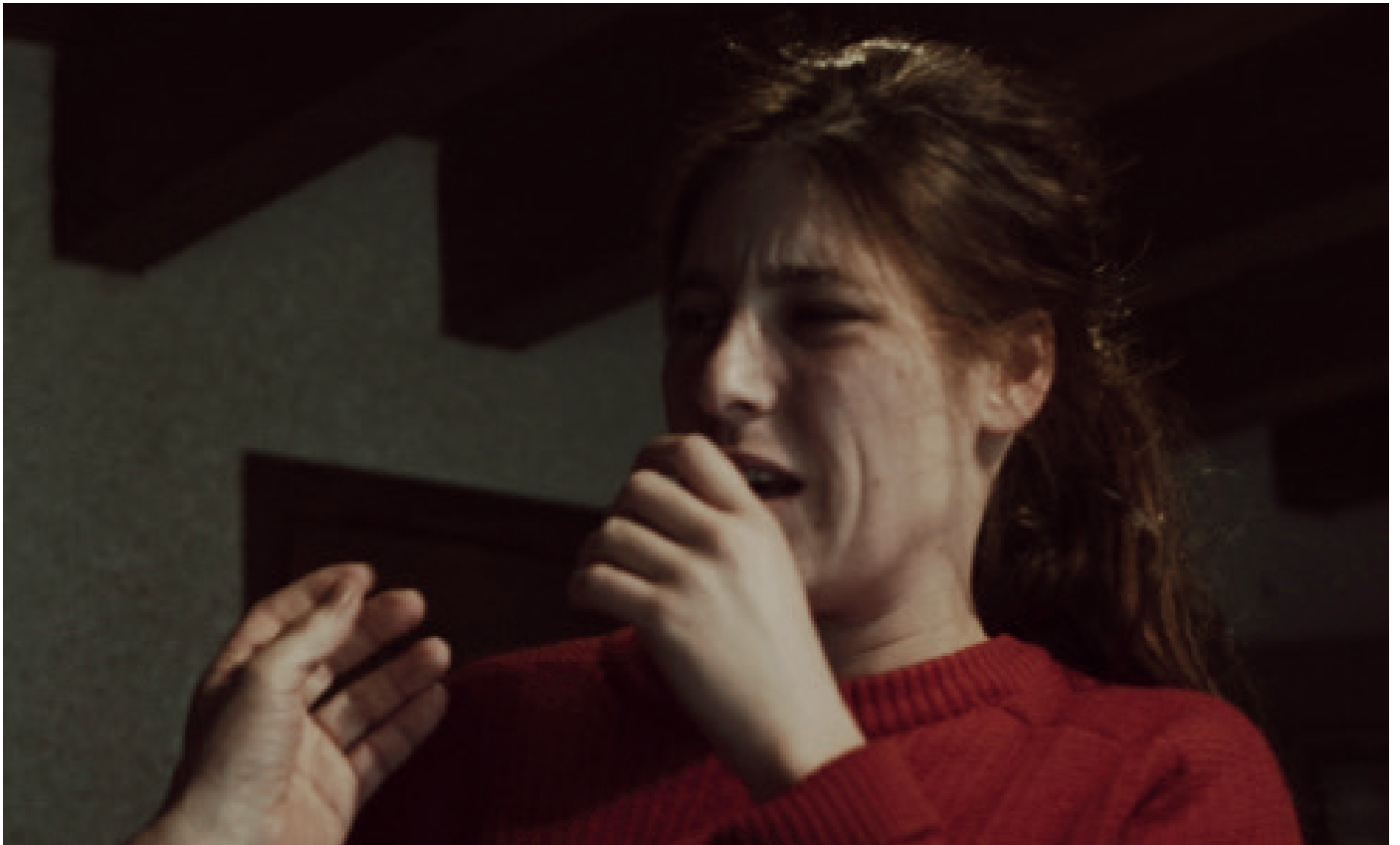
Répétition ANA

Et l'émotion est très souvent là, toujours brutale, inattendue, fulgurante. Comme dans la vie.