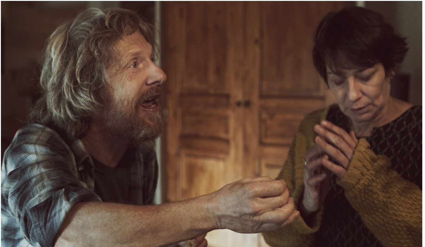
Répétition ANA

On retrouvera des scènes qui figuraient dans la dernière version du scénario, mais qui n'ont pas été tournées, ou n'ont pas été gardées au montage . Notamment un long et très beau monologue de Suzanne, où elle évoque de graves troubles psychiques, apparus six mois après la mort de son père. Récit sans doute très peu cinématographique, mais d'une grande force d'écriture.