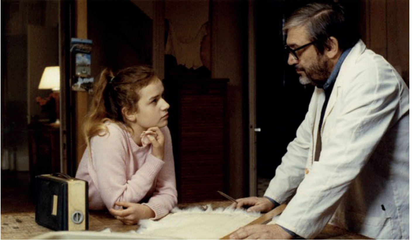
A nos Amours, 1983

Suzanne a quinze ans. En vacances sur la Côte d'Azur, elle repousse Luc, le jeune homme qui est amoureux d'elle, puis se donne à un Américain inconnu sur la plage. De retour à Paris, elle multiplie les aventures amoureuses. Ses parents se séparent. Son père quitte la maison. Elle doit faire face à l'hostilité de sa mère et de son frère. Son mariage se solde par un échec. Après avoir revu son père, elle part avec un amant aux États-Unis.