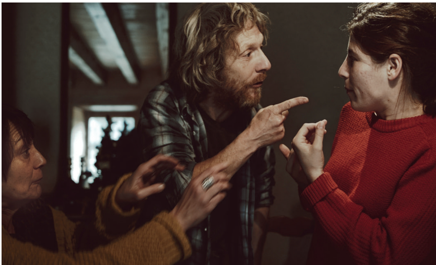
Répétition ANA

D comme Depardieu , tant le corps de Gérard Depardieu irradie dans son cinéma.