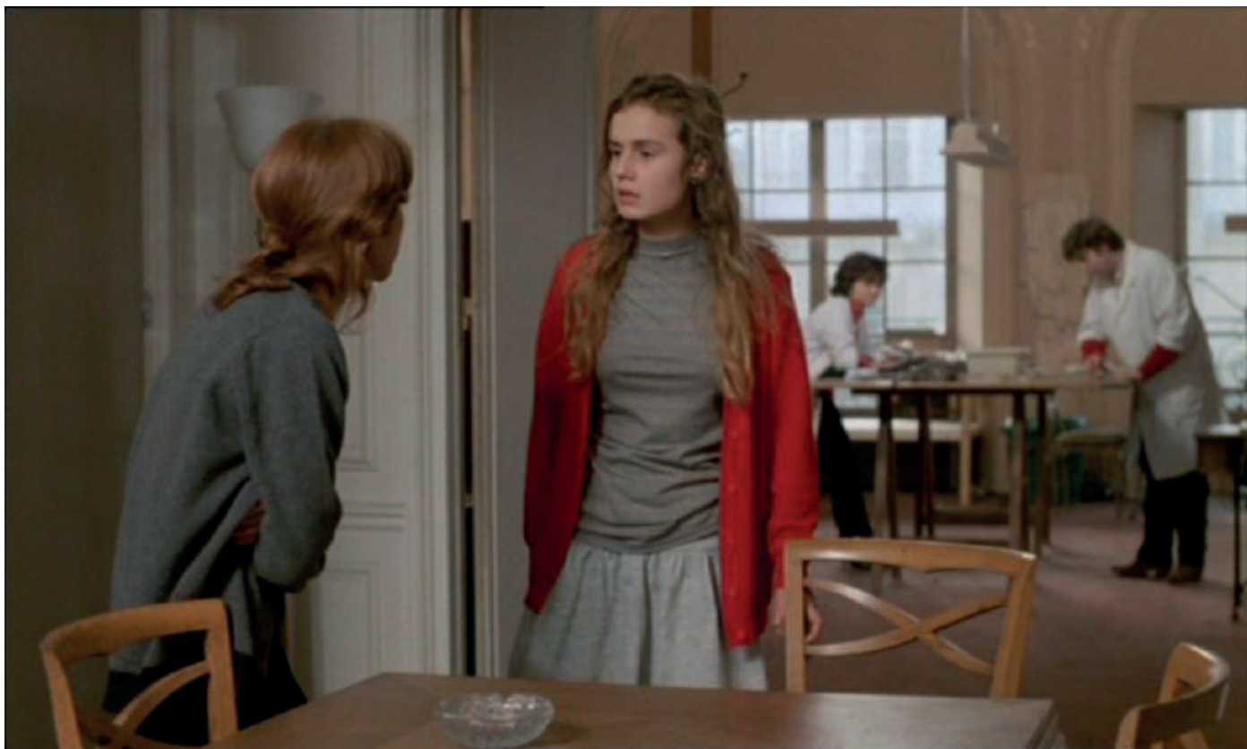
A nos amours , 1983

La caméra traque les personnages pour leur faire rendre, sinon l'âme, du moins leur vérité. La longueur des plans ou des scènes est le résultat de ces corps à corps où la violence est là sans qu'on l'ait vue arriver, et perdue jusqu'à l'épuisement des combattants.