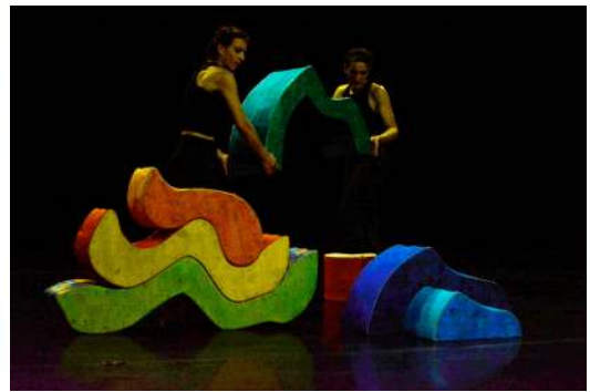
De gauche à droite : découpage Henri Matisse, jouet en bois Waldorf, création de la scénographie d'Un Secret perché