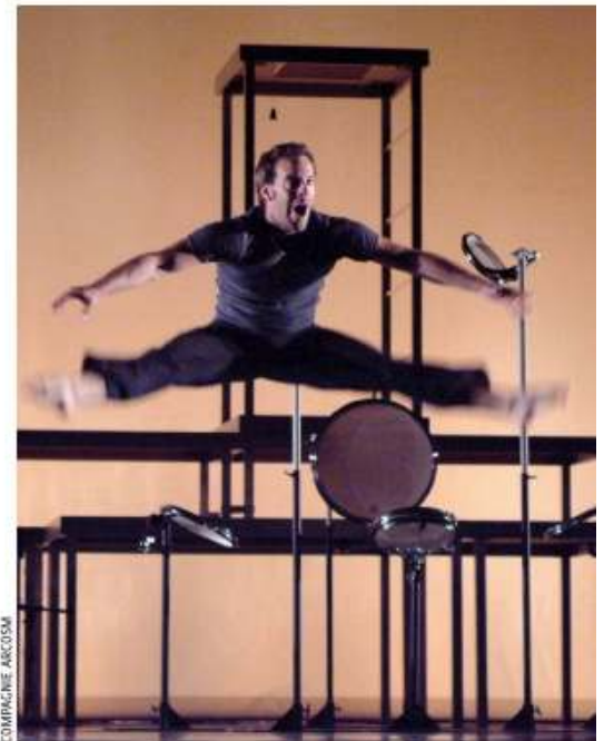
Le spectacle Echoa a été créé il y a 18 ans.

Juillet 2019, Cyrille Planson pour Le Piccolo, la lettre des professionnels du jeune public