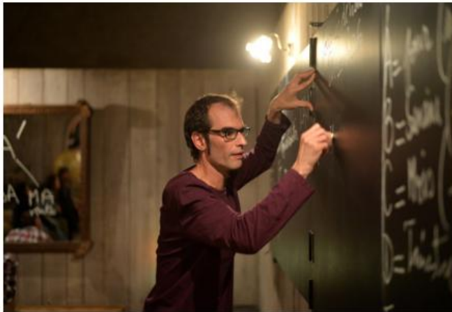
Scène de "Marx matériau"