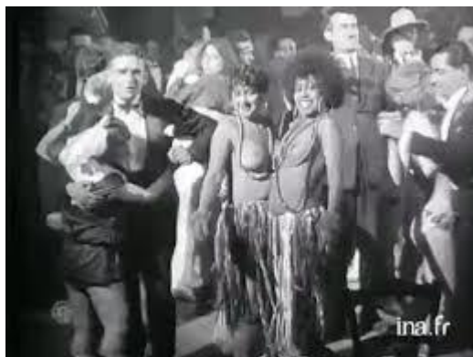
Scène de danse dans les Années Folles