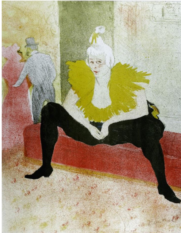
La Clownesse assise, Toulouse Lautrec