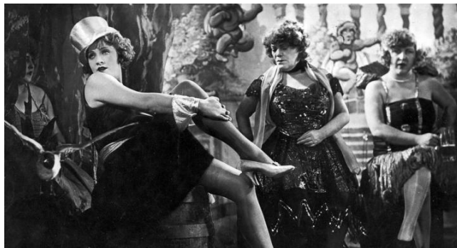
L'ange Bleu, réalisé par Josef von Sternberg