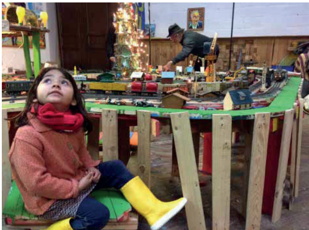
Le train de Noël de l'artiste Isidore Krapo, atelier Château Palettes, Bordeaux