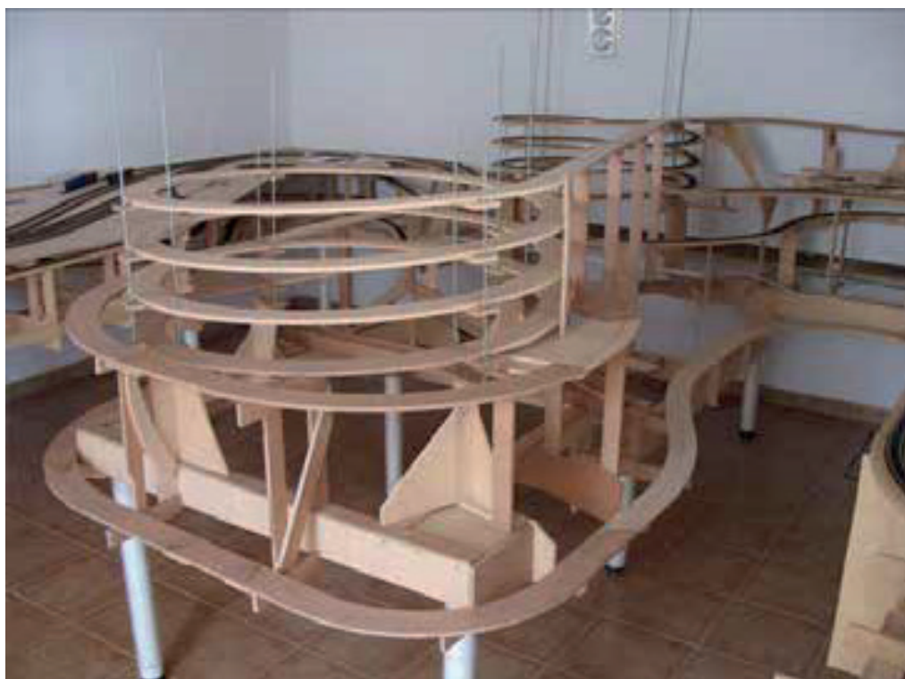
Une maquette de réseau ferroviaire