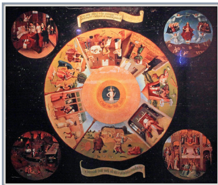
Jérôme Bosch Les Sept péchés capitaux , 1485, Musée du Prado, Madrid, Dimensions: 150 x 120 cm

« Giuseppe Pitrè, un type un peu louche, Pitrè : folkloriste, écrivain, médecin, il serrait beaucoup de mains, Pitrè. Bon ben pour lui, la mafia, c'était une supériorité d'âme, un truc en plus. Avouez qu'on n'est pas loin de l'hypertrophie de l'ego. On repense à Bosch et aux péchés capitaux érigés en tables de la Loi. »