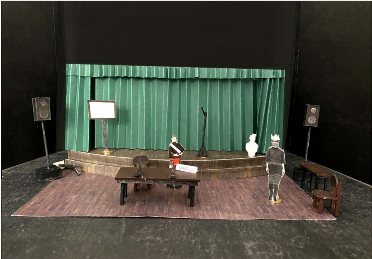
Maquette de la scénographie de Brioche et Révolution ! par la scénographe Heïdi Folliet