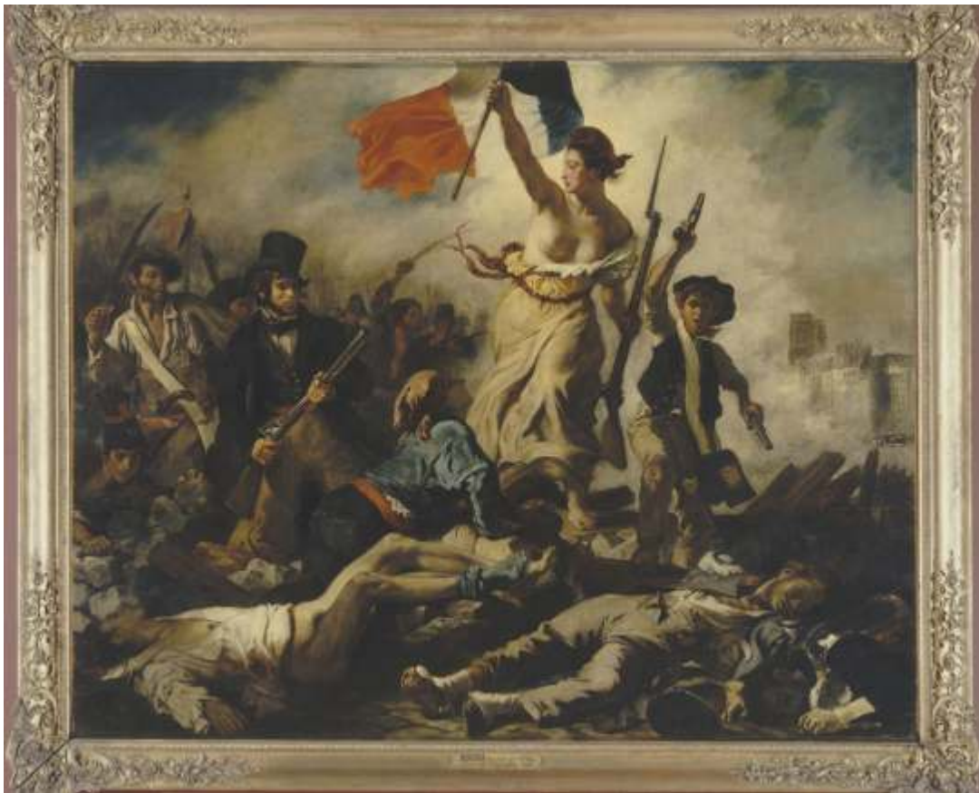
La liberté guidant le peuple , Eugène Delacroix (Le Louvre)