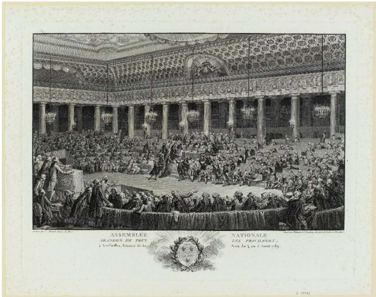
Source : gravure d'époque. Salle des menus plaisirs où se réunissent les Etats généraux.