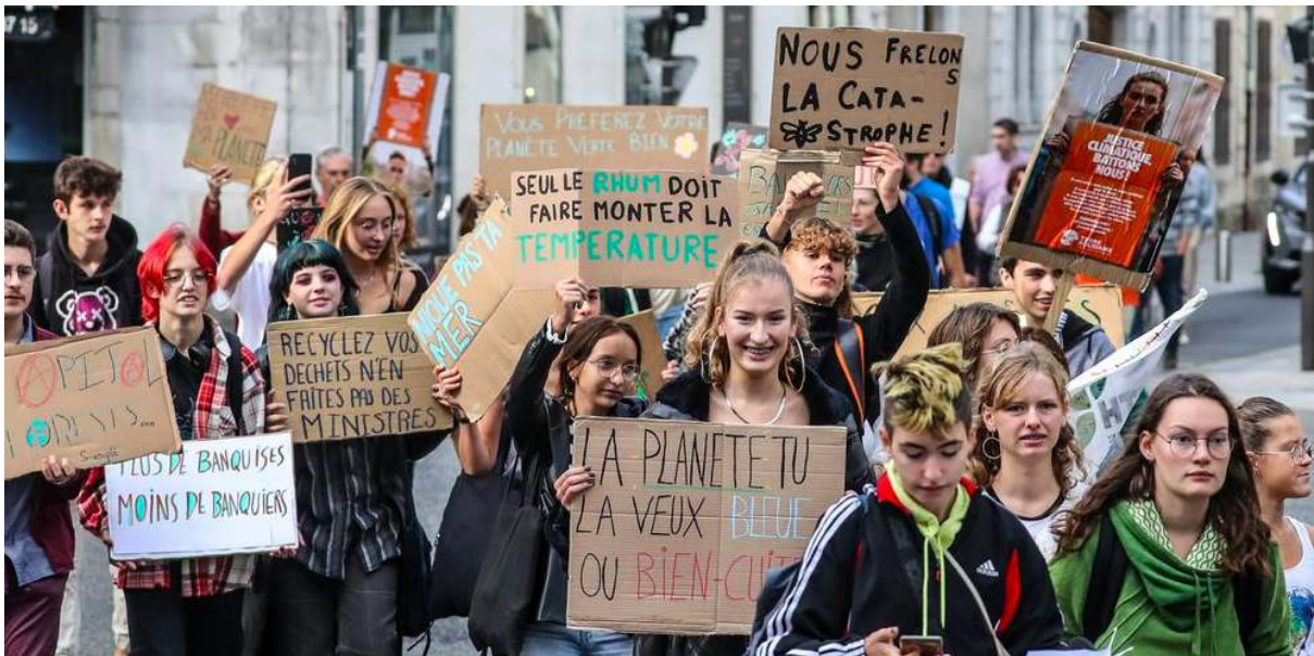
Manifestation pour le climat, 2019