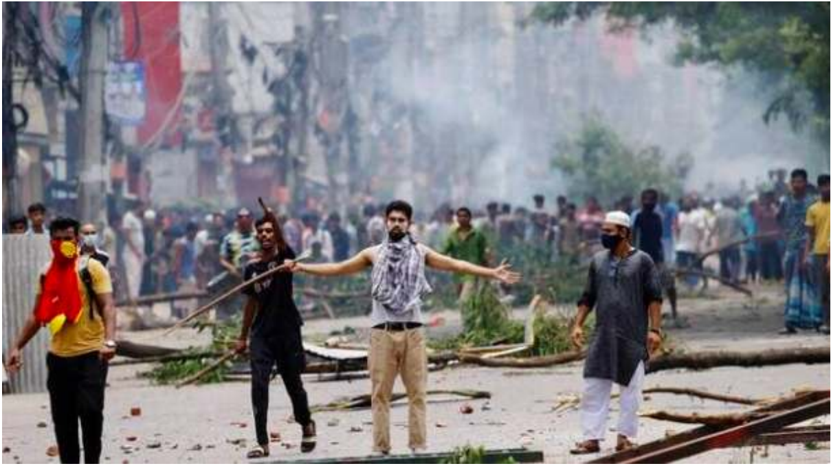
journal le monde, manifestation en Tunisie Octobre 2022