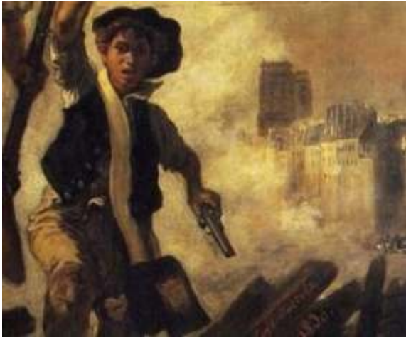
Source : détail du tableau d'Eugène Delacroix la liberté guidant le peuple