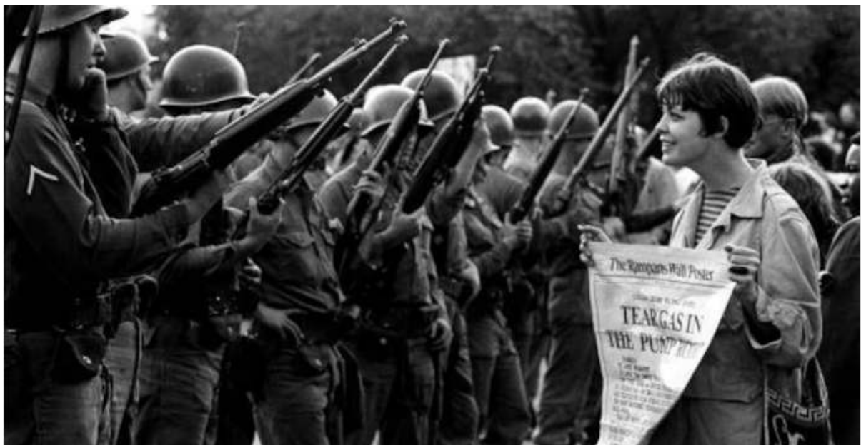
Source : manifestation contre la guerre, USA 68