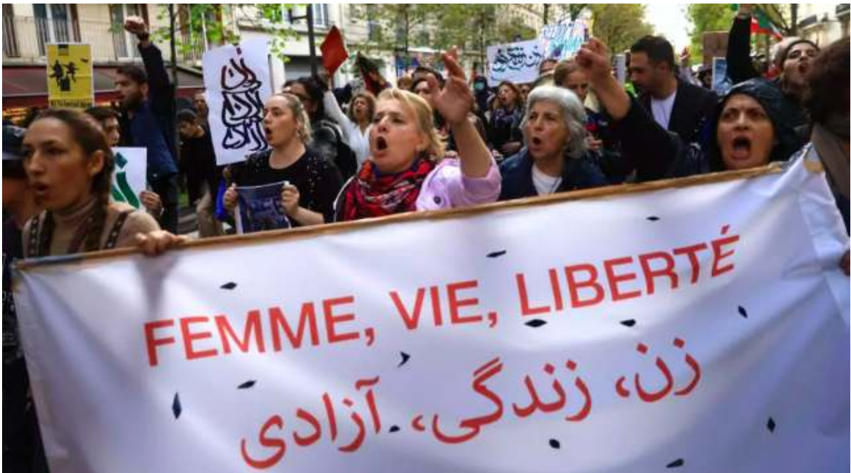
Octobre 2022, révolte des femmes contre le régime Iranien